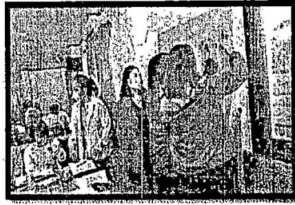
- นำเสนอแลกเปลี่ยนเรียนรู้แผนพัฒนาสุขภาพอำเภอต่อคณะกรรมการ คปสอ.นาด้วง